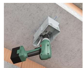
Visser le boîtier dans le plafond