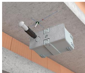
Rompre l'entrée de tube