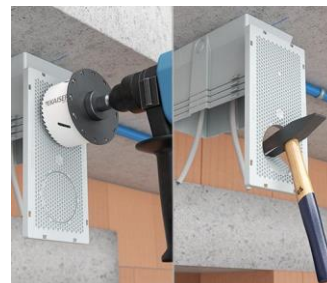
Diamètre d'encastrement 68mm à enfoncer ; diamètre jusqu'à 86mm à fraisier