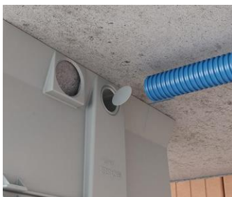
Introduire le tube ou câble dans le boîtier