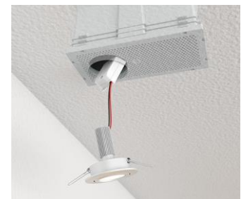
Encastrer le luminaire