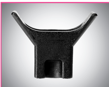
Embase à ailette