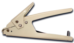
Pince pour collier d'installation